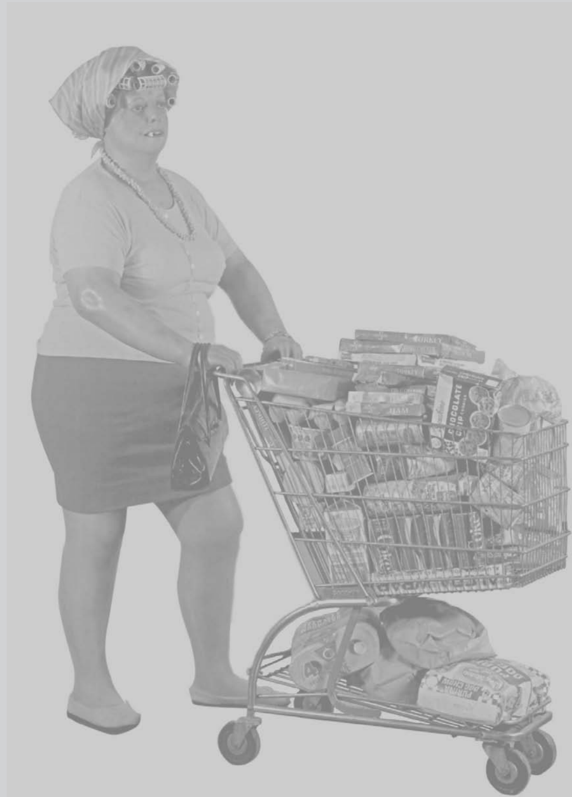
In copertina | cover Duane Hanson, "Supermarket Shopper", 1970.

In this edition, the illustrations in the Editorial and Opening are uncaptioned because they are "unnamed" design products, but not "nameless." These everyday objects are part of our daily life and are emblematic artefacts of mass production.